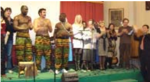
Uno dei nostri Spettacoli musicali

Da quel primo giorno di scuola , affrontato in maniera pionieristica dai quattro insegnanti fondatori che con semplicità e slancio altruistico accettarono la sfida, sono successe tante cose: i numeri non hanno fatto che crescere, sia per il continuo aumento degli studenti, sia per gli insegnanti volontari, anche l'offerta formativa ha continuato a migliorare di anno in anno, così come i momenti di incontro e intercultura (spettacoli, gite, cineforum, feste...). Oggi possiamo, perciò, affermare che la SSF non solo offre i corsi di lingua italiana, ma attraverso queste numerose iniziative, promuove cultura e sviluppo di strumenti capaci di favorire un dialogo interculturale tramite la conoscenza reciproca e una comunicazione