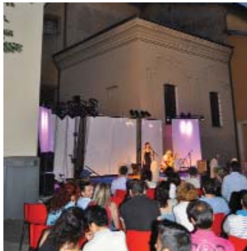
Spettacolo di giugno 2013 nella suggestiva Piazza Canonica

«Tu, o Dio non ci hai dato un cuore perché ci odiassimo. Fa che ci aiutiamo l'un l'altro, che le piccole diversità tra i nostri vestiti, le lingue, gli usi, tra tutte le nostre leggi imperfette, così diverse l'un dall'altre e così uguali davanti a Te, non siano segnali di odio e di persecuzioni»