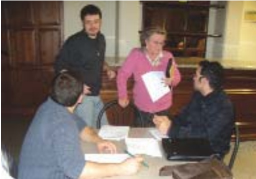
Un momento di dialogo durante le lezioni della Scuola senza Frontiere

DA VENT'ANNI LA SCUOLA SENZA FRONTIERE OFFRE CORSI DI LINGUA ITALIANA AGLI STRANIERI FAVORENDO LA LORO INTEGRAZIONE IN UN CLIMA DI AMICIZIA E COLLABORAZIONE.